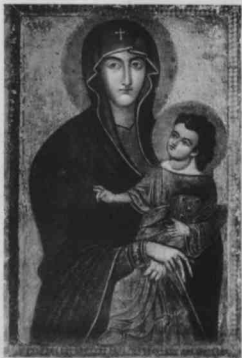
MADONNA DELLA NEVE